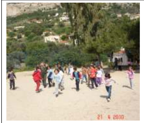
Παιδιά Α΄ και Β΄ «παίζουν κυνηγητό» με το κατσικάκι